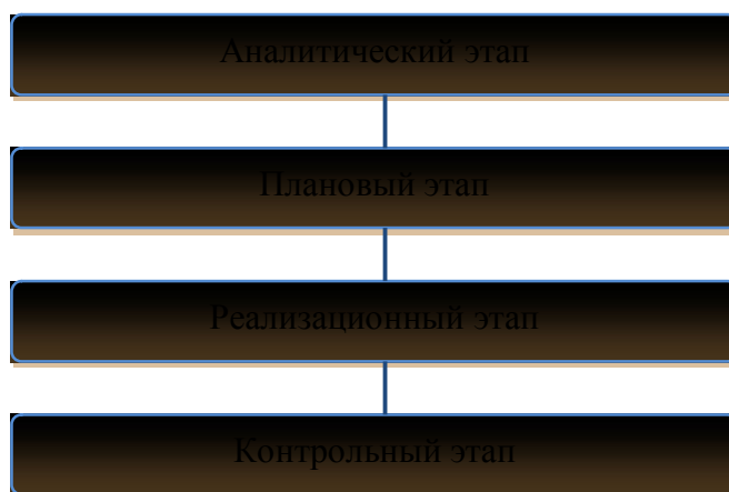
Рисунок 4 - Механизм реализации стратегического плана развития

Процессуально механизм стратегического управления можно представить в виде последовательности четырех этапов (рис. 4). При этом следует отметить, что все этапы практически неразделимы, они дополняют и продолжают друг друга.